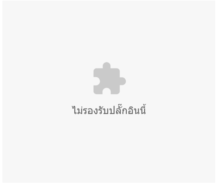
อัตราต่อแสนประชากร