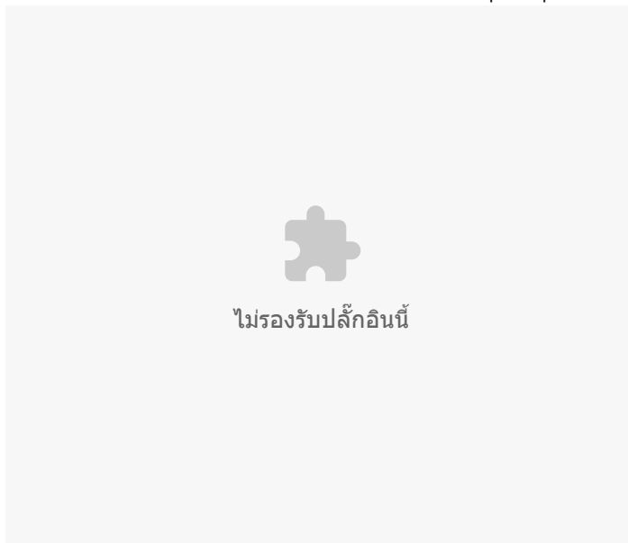
อัตราต่อแสนประชากร