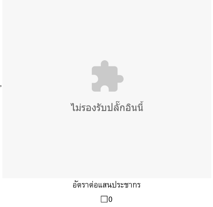
Number of Genital Herpes Simplex cases by week of onset and region 2567