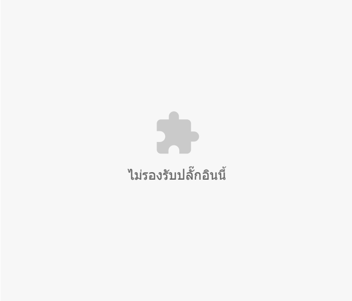
อัตราต่อแสนประชากร