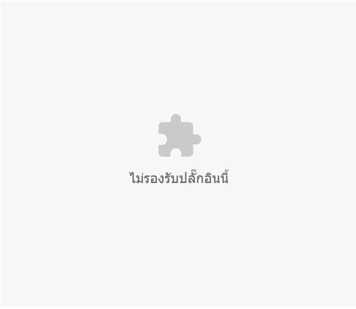
อัตราต่อแสนประชากร □ 0