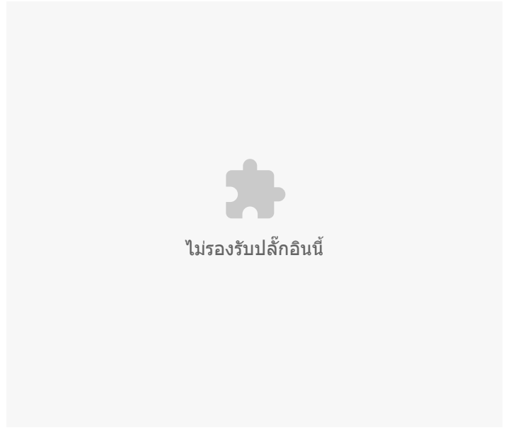
อัตราต่อแสนประชากร