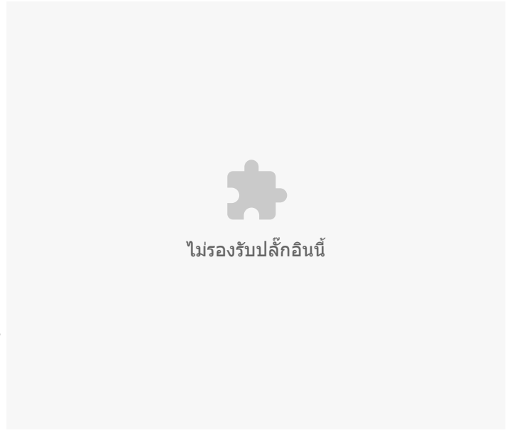
อัตราต่อแสนประชากร