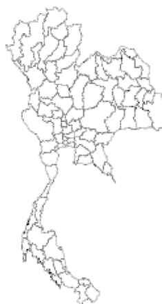
อัตราต่อแสนประชากร