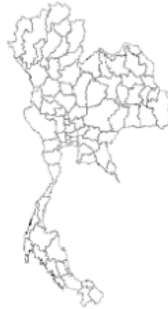
อัตราต่อแสนประชากร □ 0 □ 0.01-10 □ >10-50 □ >50-100 □ >100-500 □ >500