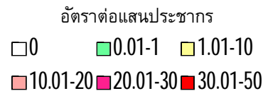
Number of HepatitisB cases by week of onset and region.